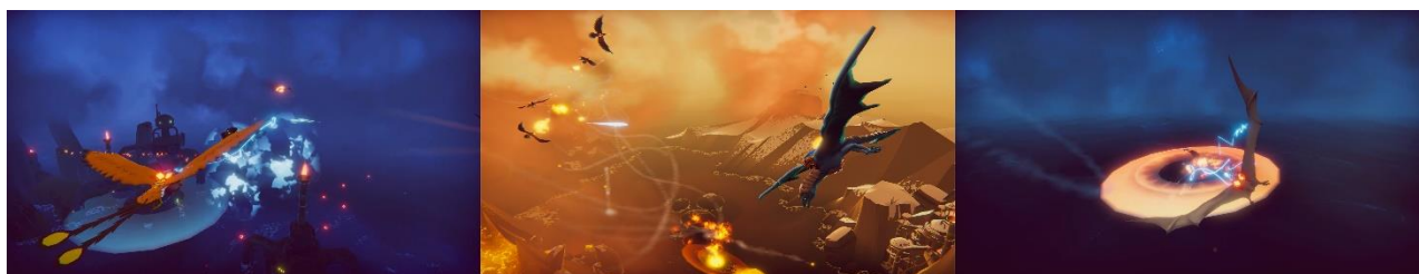
画面左から▶アービター：フェニックス ▶ハンター：オルミル（ドラゴン） ▶コルセア：古代プテロン

プレイヤーは、以下のクラスからキャラクター/ウォーバード（ファルコンなどのマウント）を選びます。クラスにより基本の速度や耐久性などが異なりますが、経験値や呪文、装備で強化していく事が可能です。