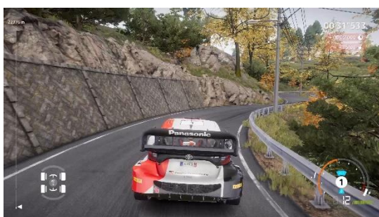
▲画面右下の電力ゲージ見ながらバッテリーを管理

本作では、今シーズンより Rally1 カテゴリーで採用されたハイブリッドカーを収録。減速時にチャージしたバッテリーを使用することで、エンジントルクが大幅に向上し、加速時に最大 30%のパワーアップを実現しました。また、加速度と電力の使用量のバランスを設定した「マップ」を選択することで、ドライバーはステージにあわせた戦略を最適化することが可能です。